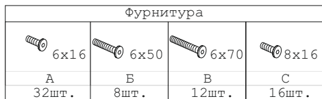
Схема сборки стола-тандема D-40, D-41, D-42, D-61, D-62